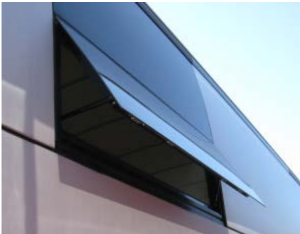
Fig. 1 Vue type d'une fenêtre à auvent

NOTE : Les véhicules concernés peuvent être équipés d'une ou plusieurs fenêtres à auvent.