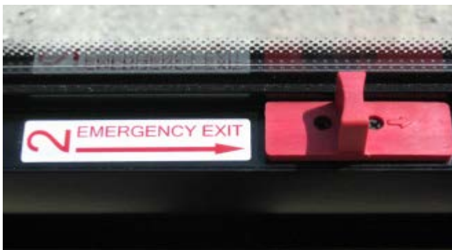
Fig. 5 Autocollant # 2