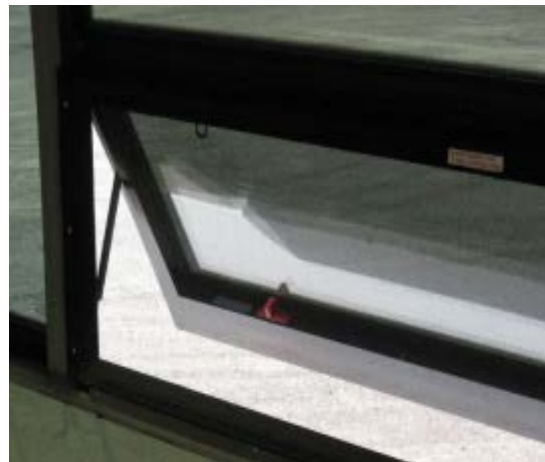
Fig. 2 Vue intérieure d'une fenêtre à auvent