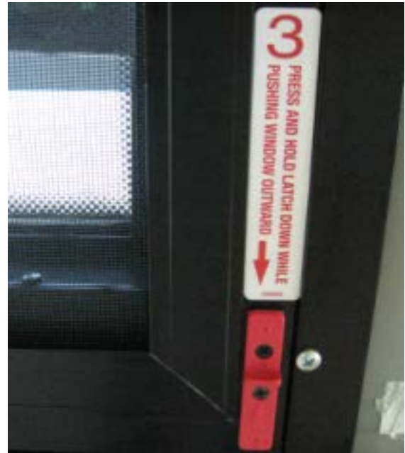
Fig. 6a Nouvel Autocollant # 3 (#299098)