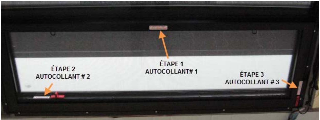
Fig. 3 Séquence d'ouverture d'urgence d'une fenêtre à auvent.