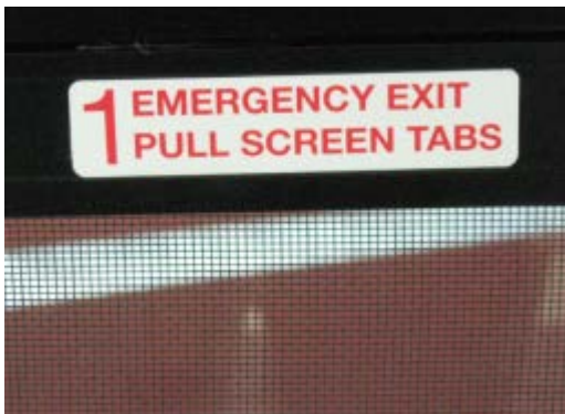
Fig. 4 Autocollant # 1