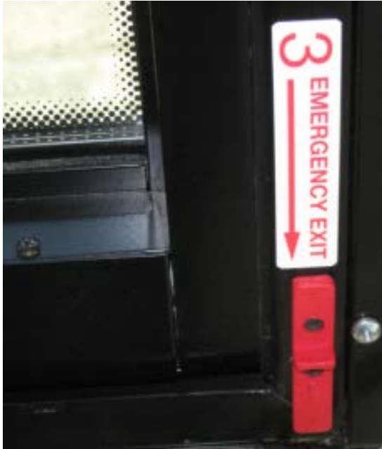
Fig. 6b Autocollant original # 3 à remplacer (#790601).