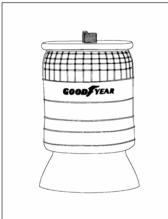
FIGURE 1: NOUVEAU MODÈLE DE RESSORT

Sur les véhicules ci-dessus mentionnés, le nouveau modèle de ressorts pneumatiques peut avoir été installé avec l'ancien modèle sur le même véhicule. Les deux modèles de ressorts pneumatiques ont des propriétés et des caractéristiques identiques, il n'y a que l'apparence qui change.