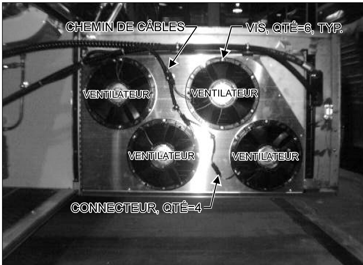
FIGURE 1: PORTE DU CONDENSEUR - FAÇADE INTÉRIEURE