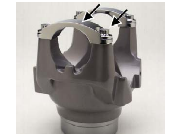
FIGURE 3 : RETENUE DE PALIER FORMÉE À FROID ET BOULONS TEL QU'UTILISÉ SUR LES VÉHICULES PREVOST

NE réutiliser NI les retenues de palier formées à froid NI les boulons. La réutilisation des retenues de palier et des boulons peut causer une panne de ligne cinématique, qui peut entraîner la séparation de l'arbre de transmission.