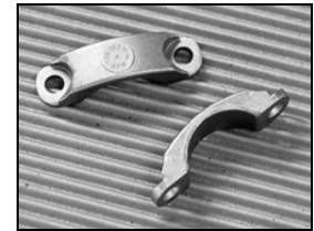
FIGURE 2 : RETENUE DE PALIER (formée à froid)