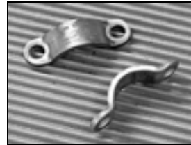
FIGURE 1 : COLLETS (estampés)

NE réutiliser NI les lames ressorts NI les boulons de lame ressort.