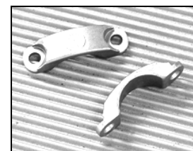
FIGURE 2 : RETENUE DE PALIER (formée à froid)