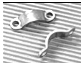
FIGURE 1 : COLLETS (estampés)

NE réutiliser NI les lames ressorts NI les boulons de lame ressort.